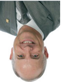
Jaume Bosch i Puges Alcalde

Un any més la nostra ciutat celebra el Cros Solidari per la Salut Mental. Un esdeveniment que vol unir la pràctica d'una activitat física saludable i la nostra solidaritat amb aquelles persones que pateixen malalties mentals. Enguany el cros arriba en un moment molt especial per la ciutat. Acabem d'inaugurar un nou Hospital General, que completa un Parc Sanitari que ha fet realitat l'atenció sanitària integral en un mateix complex assistencial modern i de qualitat. Un nou motiu d'alegria que ens anima a participar i a compartir amb més il·lusió, si cal, aquesta cita popular de la tardor. Us convido, doncs, a participar-hi i a gaudir plenament d'una jornada pensada per mantenir en forma el cos i la ment, al mateix temps que ens permet mostrar la nostra solidaritat, fer noves amistats i fomentar valors tan positius com la convivència. El Parc de la Muntanyeta se'n obre de bell nou per passar un dia agradable i distès. Gràcies per participar-hi!